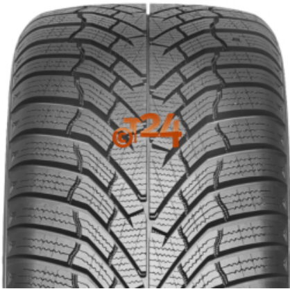
Abbildung zeigt: KUMHO WP52 WINTERCRAFT (Je nach Reifenbreite kann das Profilbild abweichen)