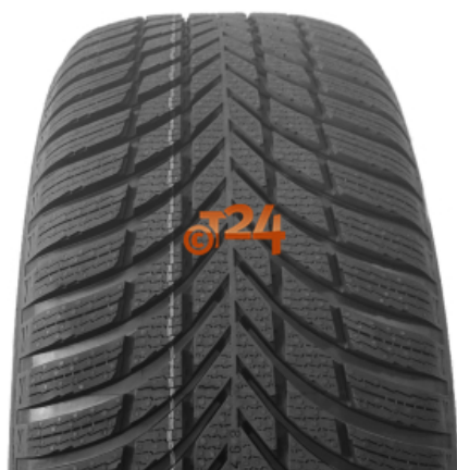
Abbildung zeigt: NOKIAN SNOWPROOF 2 (Je nach Reifenbreite kann das Profilbild abweichen)